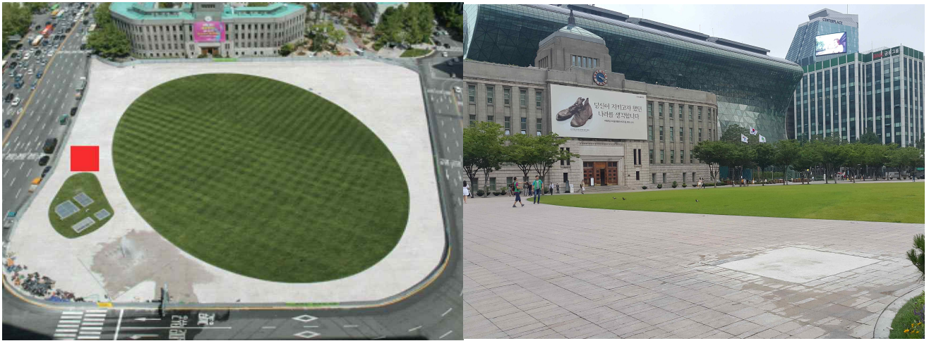
< 작품 전시 위치 및 풍경 >