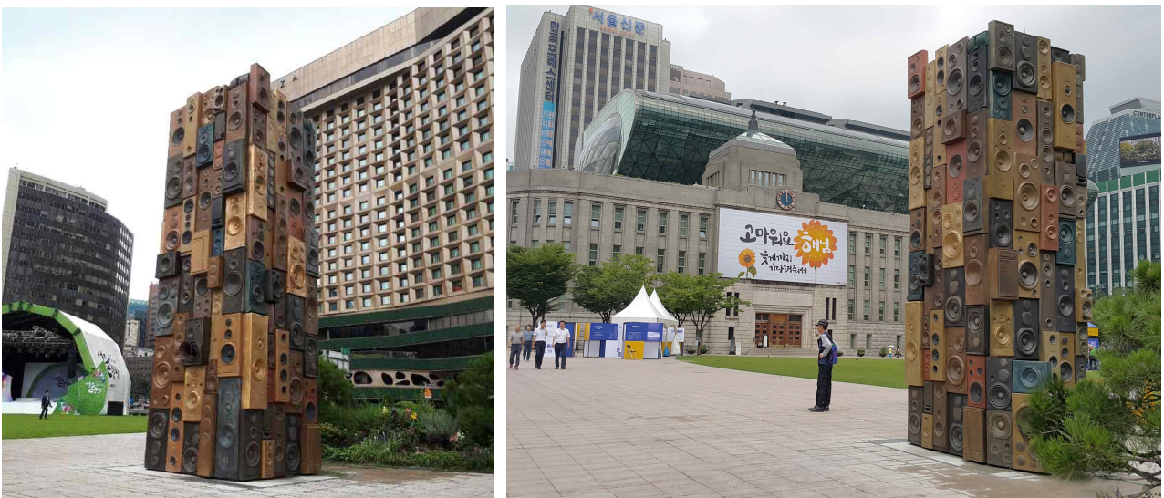
< 전시 중인 '시민의 목소리' >