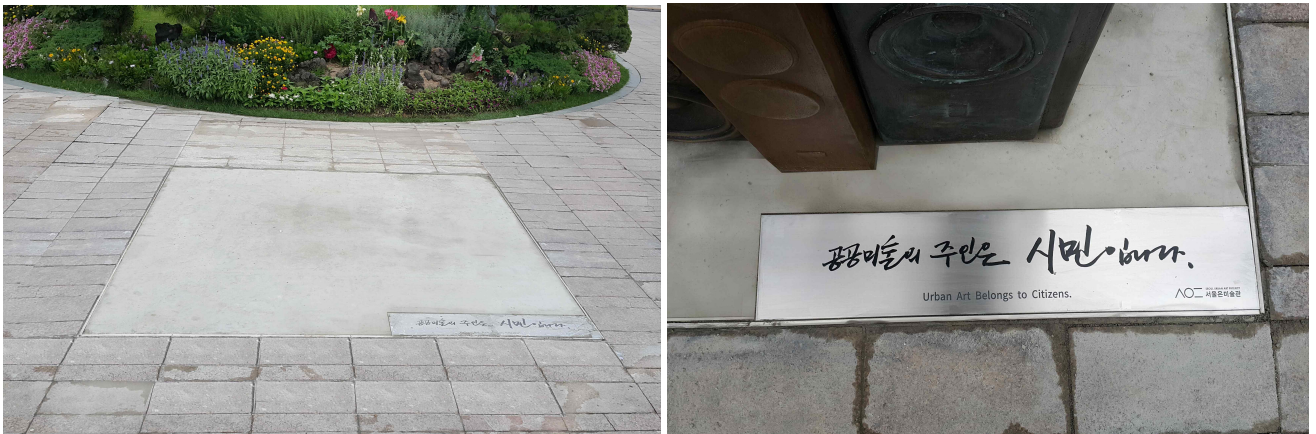
< 작품 전시 좌대 >